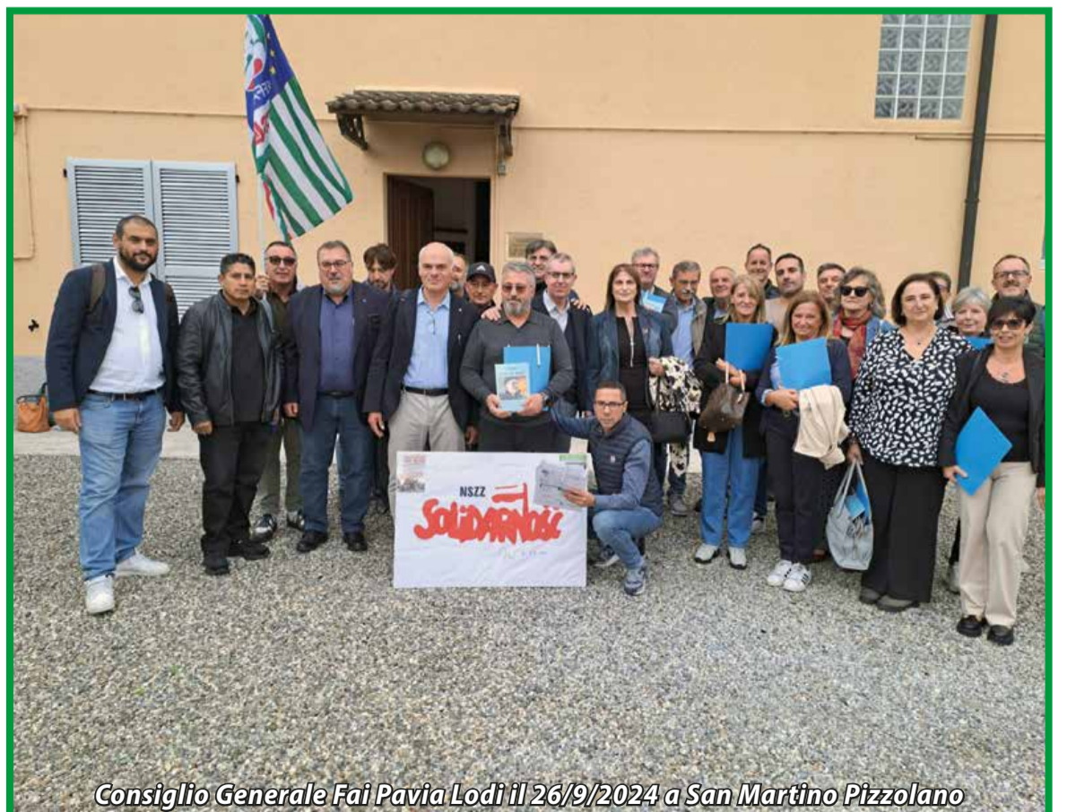
Consiglio Generale Fai Pavia Lodi il 26/9/2024 a San Martino Pizzolano

Vuoi ricevere "VITA NEI CAMPI" per Mail?